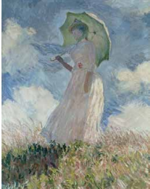
Claude Monet: Frau mit Sonnenschirm, 1886