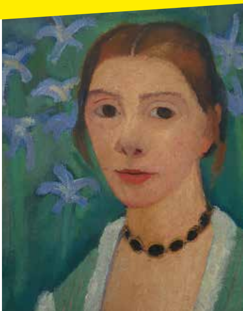
Paula Modersohn-Becker: Selbstbildnis vor grünem Hintergrund mit blauer Iris, 1900 - 1907