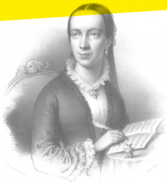
Lithographie Eduard Meyer nach einer Zeichnung von Pauline Suhrlandt